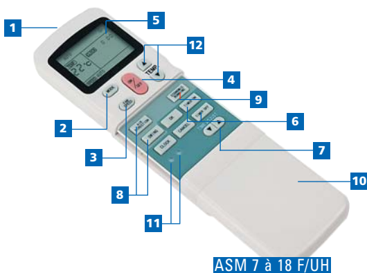
ASM 7 à 18 F/UH